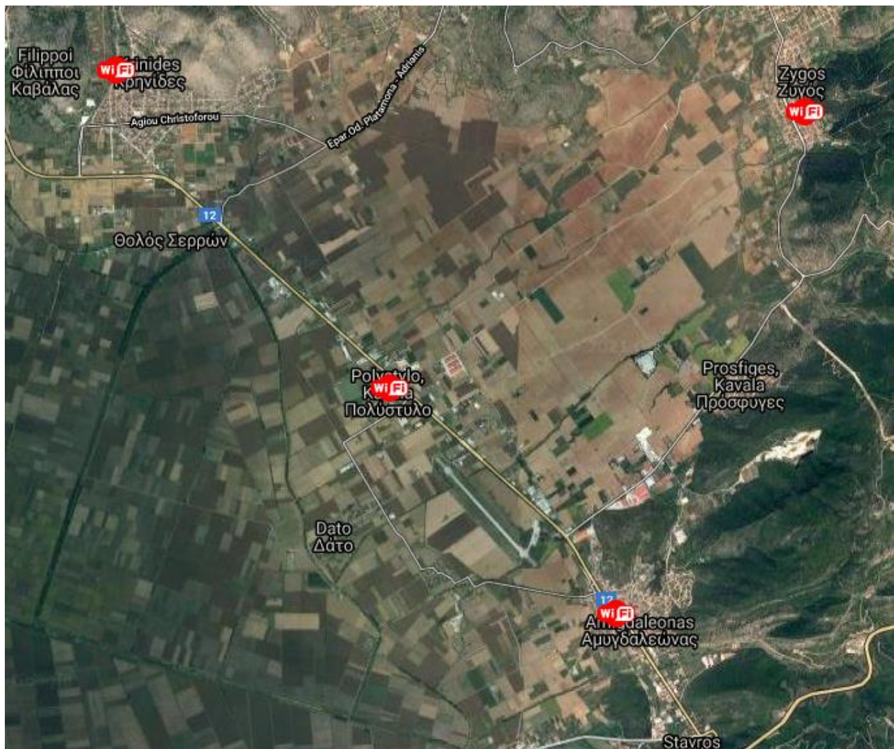
Εικόνα 1. Σημεία ασύρματης δικτύωσης εκτός αστικού ιστού, πλην Νέας Καρβάλης.