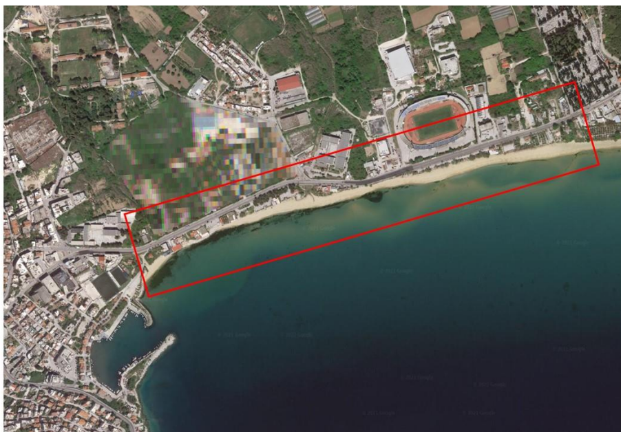
Εικόνα 2: Αεροφωτογραφία με εντοπισμένη την περιοχή του έργου

Τα υλικά που επικρατούν στην ευρύτερη περιοχή της παραλιακής οδού είναι το οπλισμένο σκυρόδεμα και η ασφάλτος. Μια μικρή ζώνη λιθόστρωτων πεζοδρομίων εκατέρωθεν του κεντρικού δικτύου δεν καταφέρνει να συμβάλει ουσιαστικά στην βελτίωση της αισθητικής και της γενικότερης ποιότητας του αστικού υπαίθριου χώρου. Σημαντική είναι επίσης και η ύπαρξη του πρασίνου με τα δέντρα συγκεντρωμένα σε τμήματα της περιοχής, που δίνουν την εικόνα της εγκατάλειψης. Ο υφιστάμενος ηλεκτροφωτισμός αφορά μόνο την λειτουργία της οδού ενώ στους ελεύθερους χώρους είναι αδύναμος, ενώ περιορισμένα είναι και τα στοιχεία αστικού εξοπλισμού (καθιστικά, κάδοι απορριμμάτων, κρήνες). Είναι προς εξέταση η χωρική και χρονική συνύπαρξη της όποιας περιορισμένης κυκλοφορίας αυτοκινήτων με τους πεζούς. Σημαντικό επίσης είναι το θέμα της απρόσκοπτης κυκλοφορίας των Α.μ.ε.Α. στο σύνολο της υπό διαμόρφωση περιοχής.