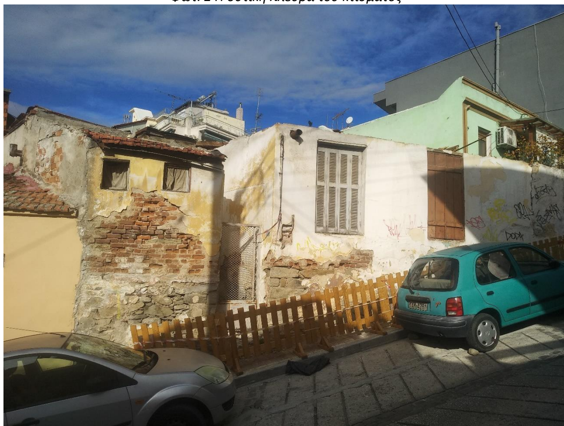
Φωτ. 3 Η ανατολική πλευρά του κτίσματος