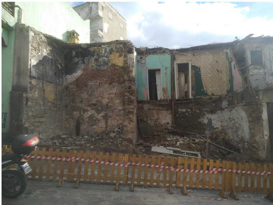
Φωτ. 2 Η δυτική πλευρά του κτίσματος

Σύμφωνα με το με αριθμ.πρωτ. 5546/02-11-2023 έγγραφο της Υπηρεσίας Δόμησης του Δήμου Καβάλας, φερόμενοι/νες ιδιοκτήτης/τριες είναι οι Καρκάλης Αντώνιος, Κούκου Όλγα, Κουντουρά Ελισσάβετ, Καρκάλης Ελευθέριος, Καρκάλη Ελλη, Καρκάλη Παρασκευή και Καρκάλη Δόμνα.