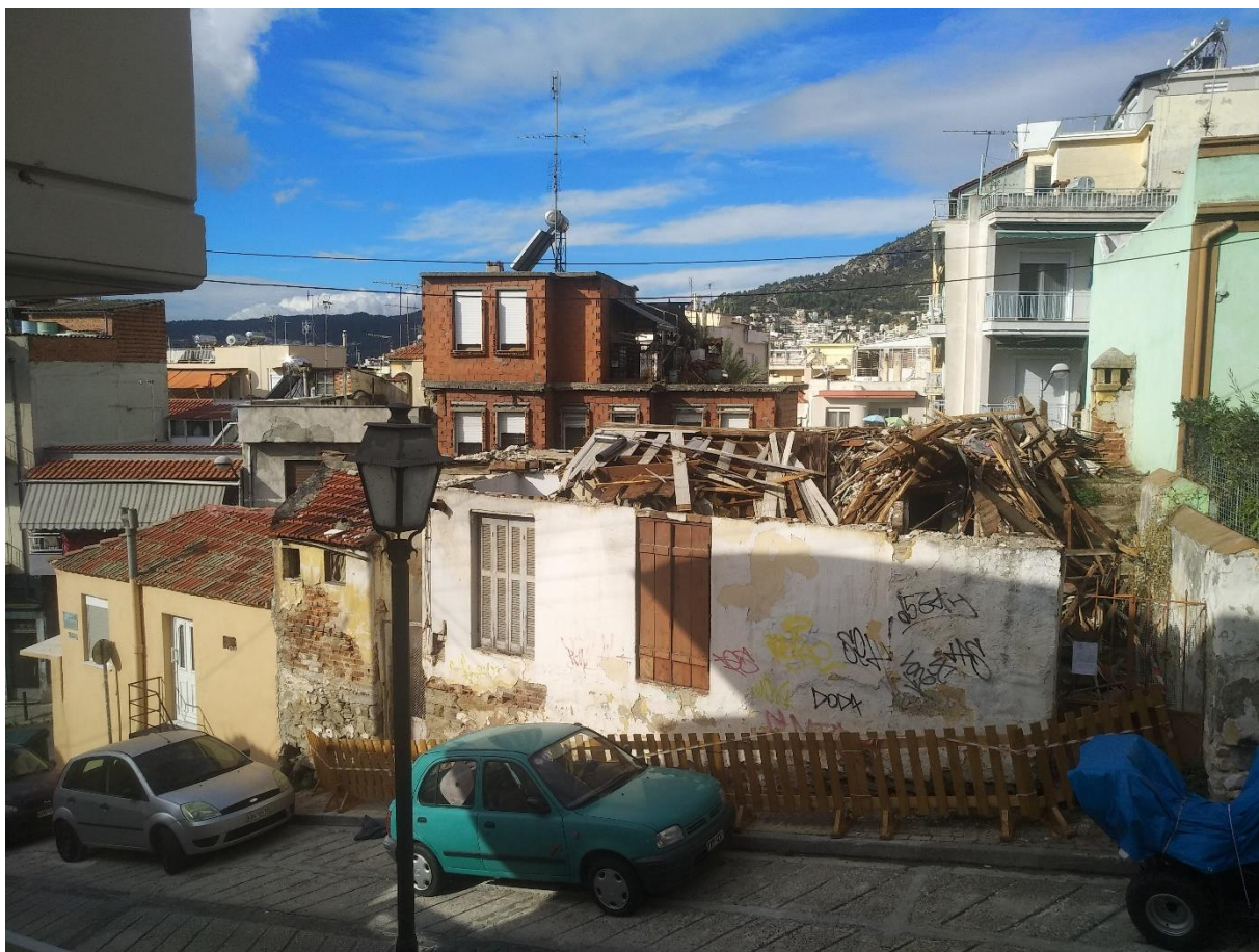
Φωτ. 4 Η ανατολική πλευρά του κτίσματος όπου τα υπολείμματα της κατεδάφισης εντός του χώρου.

Το κτίσμα βρίσκεται σε ερειπιώδη κατάσταση. Ο όροφος, η στέγη, το σύνολο της δυτικής τοιχοποιίας και οι εσωτερικοί διαχωριστικοί τοίχοι έχουν καταρρεύσει. Αποδομημένοι διατηρούνται μόνο οι τοίχοι του ισογείου και ο εξωτερικός τοίχος του 1 ου ορόφου από την πλευρά της Κ. Πουητού. Τα μάζα της κατάρρευσης βρίσκονται εντός του χώρου.