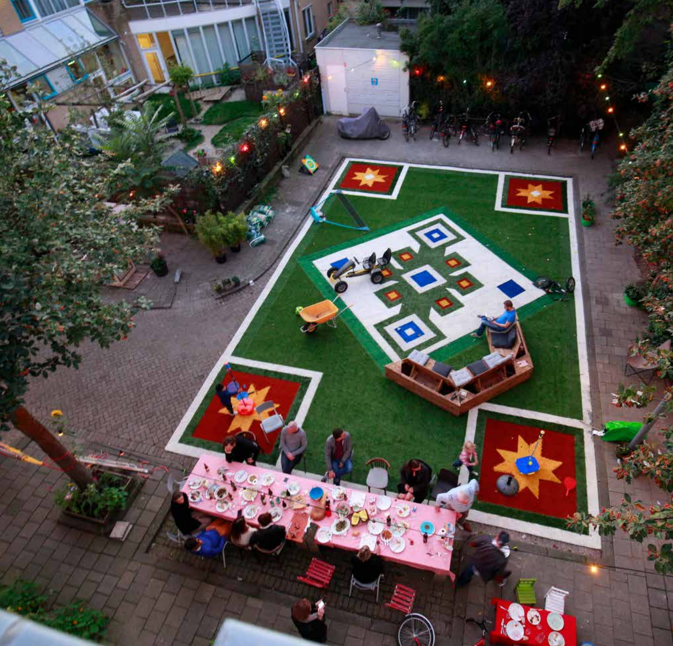
# 4 Living Streets - Από τη συμμετοχή στην ανάληψη ευθύνης