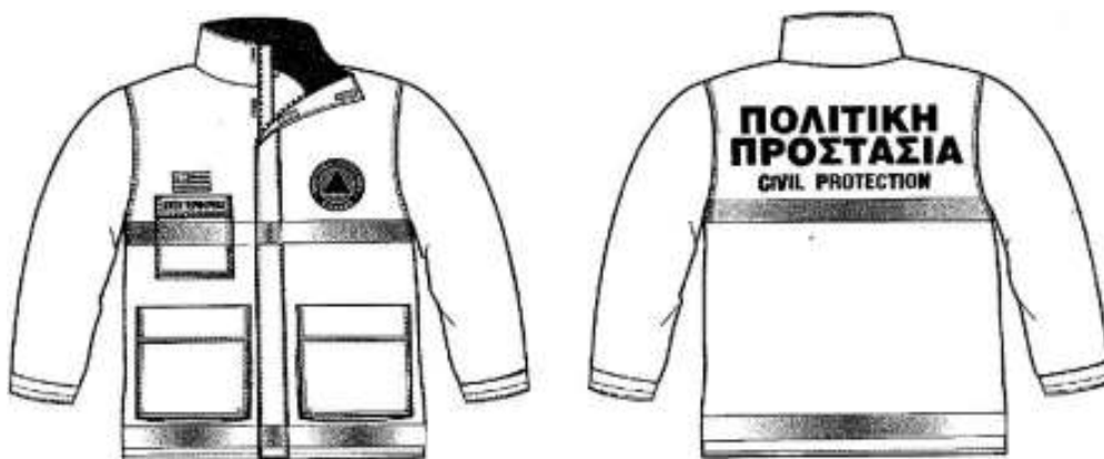
Εικόνα 1. Επιχειρησιακά μπουφάν Πολιτικής Προστασίας

Σύμφωνα με το 4678/22-11-2004 έγγραφο ΓΓΠΠ, τα επιχειρησιακά μπουφάν Πολιτικής Προστασίας θα πρέπει να έχουν την ακόλουθη μορφή: