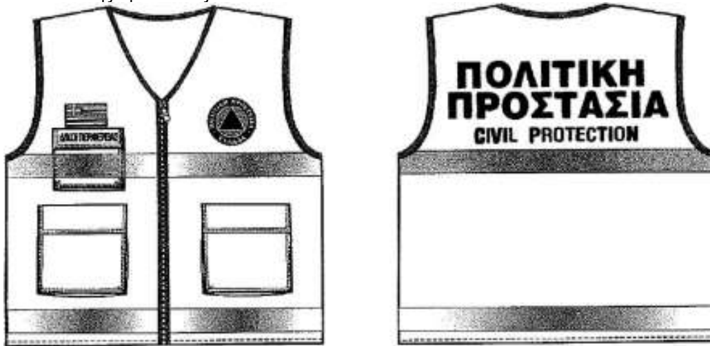
Εικόνα 2. Επιχειρησιακά γιλέκα Πολιτικής Προστασίας

Αναλυτικές προδιαγραφές για την εμφάνιση των επιχειρησιακών μπουφάν και γιλέκων Πολιτικής Προστασίας δίνονται στο 4678/22-11-2004 έγγραφο ΓΓΠΠ.